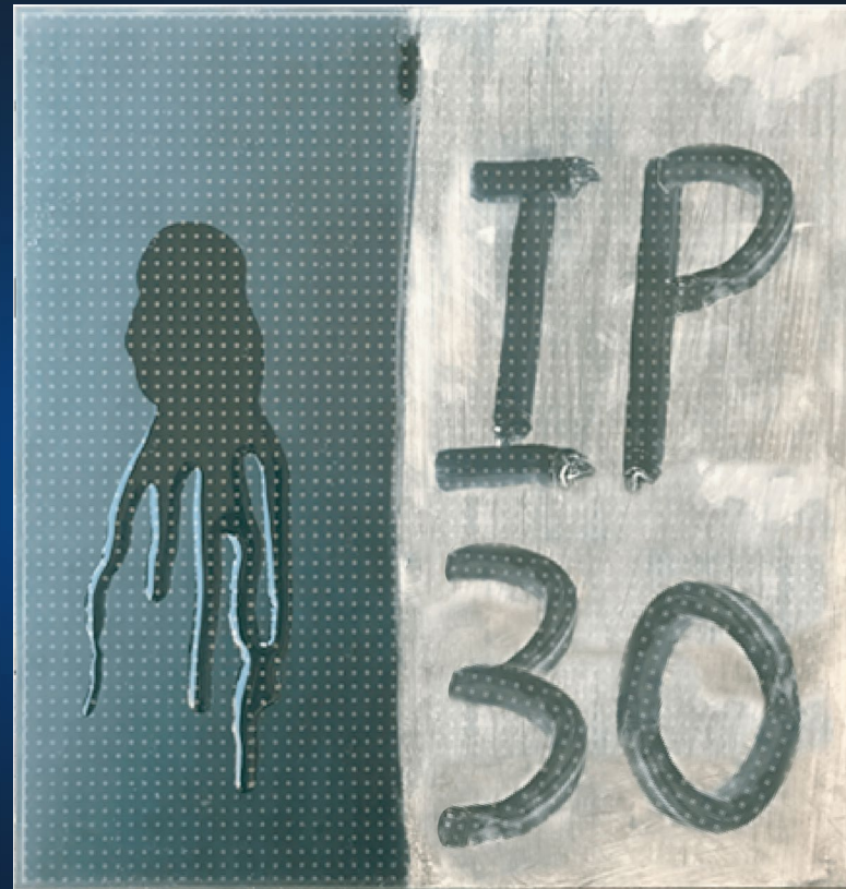
Protección IP30 *Resina opcional

Es resistente al polvo, protegiendo eficazmente a la pantalla frente a entornos corrosivos.